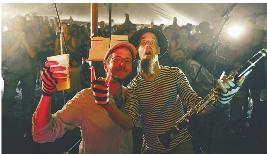
Koncert HUSO na UnArt stage ve vojenském stanu