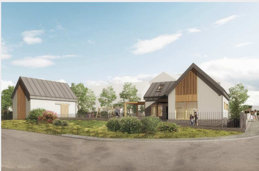
Vizualizace dětské skupiny v č. p. 20 na křižovatce u hospody. Autor: Ing. arch. Jiří Čech

Dětské skupiny v České republice zajišťuje Ministerstvo práce a sociálních věcí, a sem také chceme podat žádost k poskytnutí 100% dotace na rekonstrukci. I když v této fázi ještě neznáme přesný rozpočet plánované