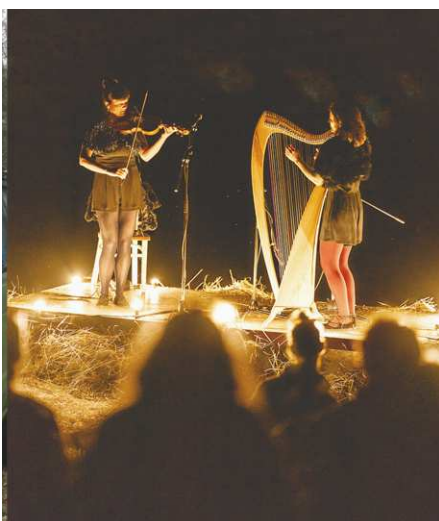
Koncert Delioù na lesní Amfiteátrové stage