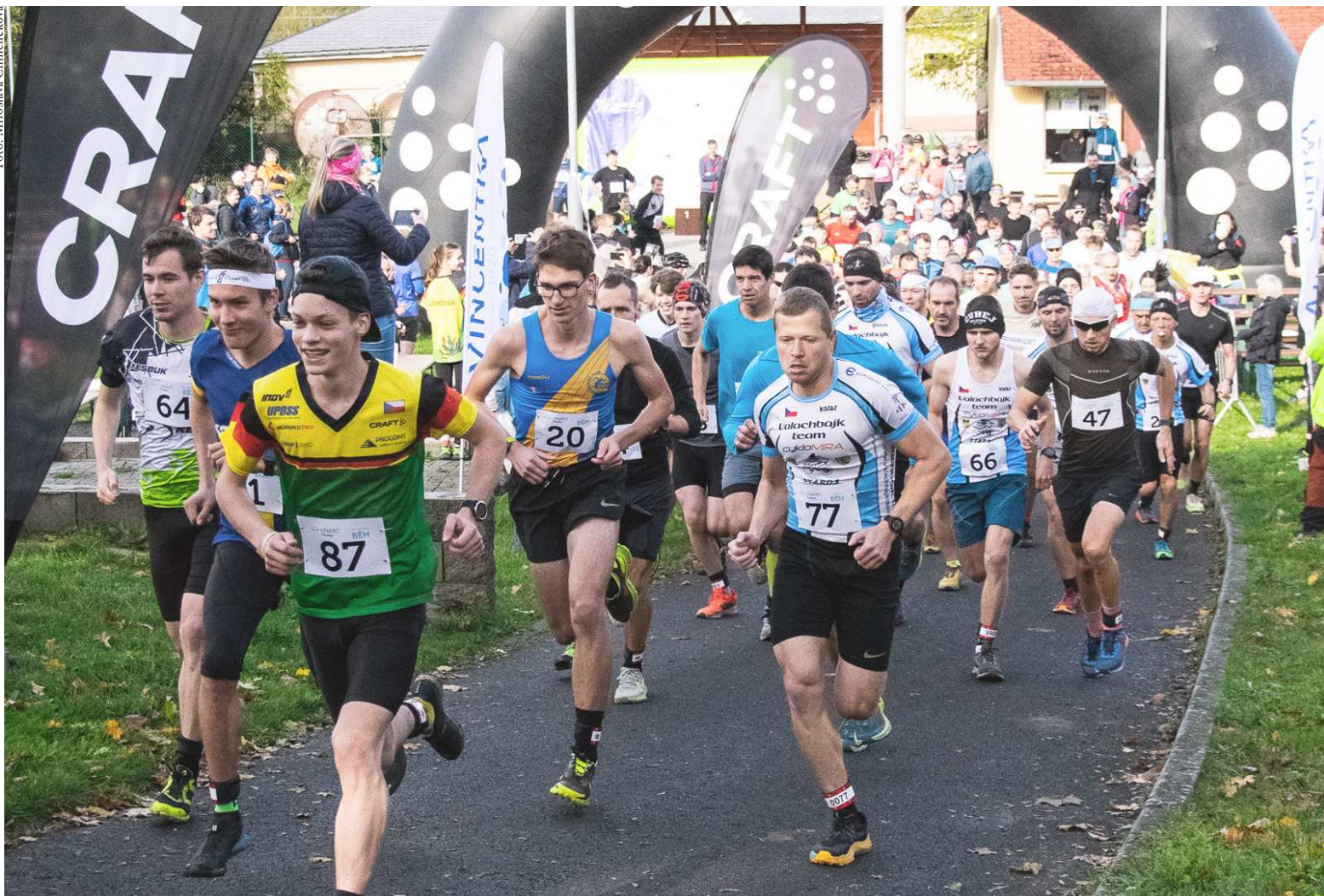
Start běhu v Areálu mládí

Sblížíím se koncem roku 2023 mi dovolte Vás seznámit s několika akcemi, kterými UnArt Provodov přispěl do kulturního či sportovního života v obci Provodov.