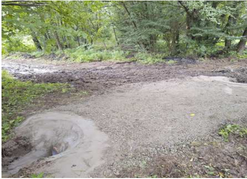
Propustek Za Nivama