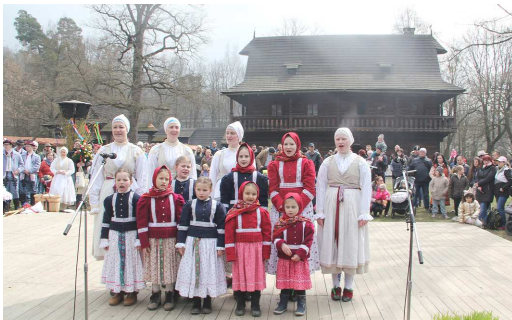
Velikonoce ve skanzenu (Rožnov pod Radhoštěm duben 2023)