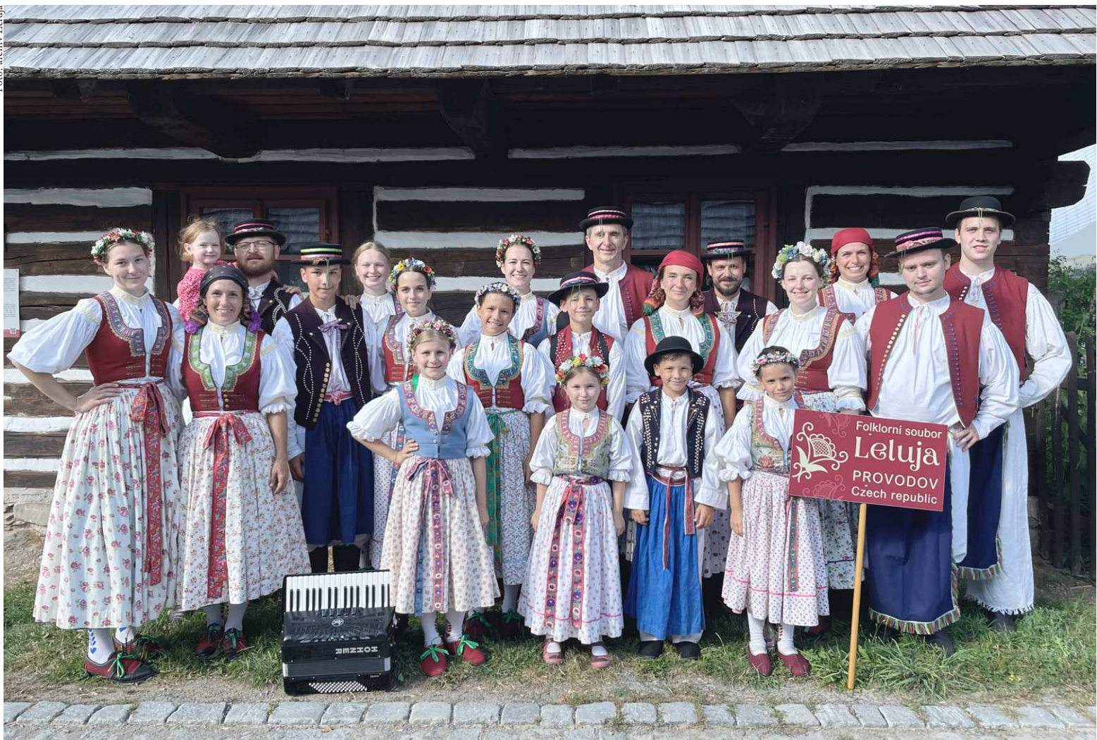
Adámkovy folklorní slavnosti, Betlém Hlinsko v Čechách - srpen 2023

V letošním roce jsme oslavili již 15 let činnosti folklorního souboru Leluja. Při této příležitosti se uskutečnil 25. listopadu v kulturním domě na Provodově velký galakonzert, kde se divákům představily všechny složky souboru s hudebně-tanečně-dramatickým pásmem tvořeným místními tanci, písněmi, lidovými zvyky a dětskými hrami. Nejmenší členové (tzv. Malá Leluja), kterých je aktuálně kolem dvaceti, předvedli svá pásma Voda, Žaba skřehoce, Děcká svadba a další. Velká Leluja se přidala např. s Otvíráním studánek, nebo s pásmo nazvanými Zábava pod májů, Fěrtúšek, Nepůjdu já za takého a ženský sbor si mimo písniček připravil i vtipné Povídání na Zálesí a O chlapoch. Všechny doprovázela naše hudecká muzika.