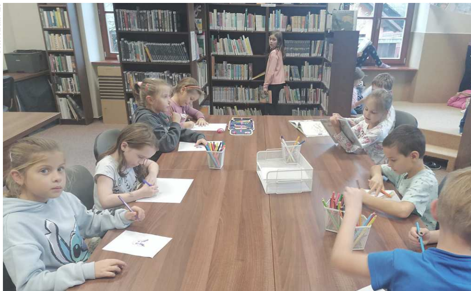
Děti v obecní knihovně