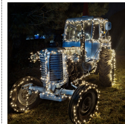
↑ Ozdobený historický traktor Zetor 25