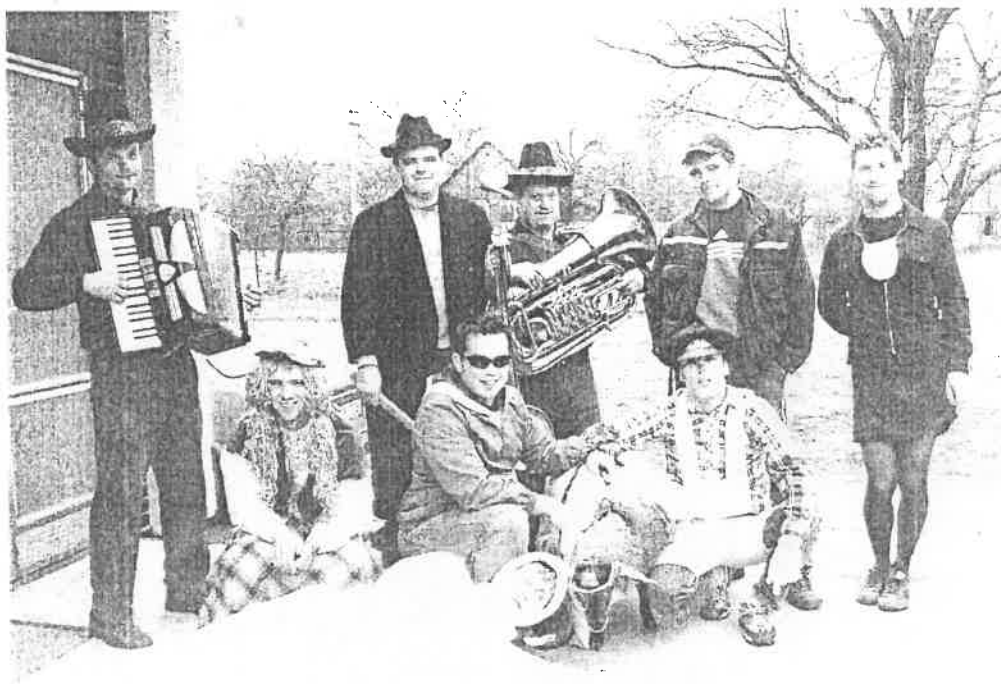
Vodění berana v roce 2005

Velmi nám záleží na zachování tradic. K jedné z nich patří i vodění berana v hodový čas. Spolu s hasiči z Březůvek pořádáme i hodovou zábavu.