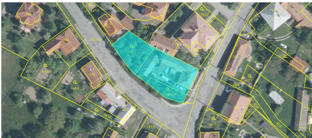
Vyobrazení: nemovitosti nově nabyté obcí Provodov